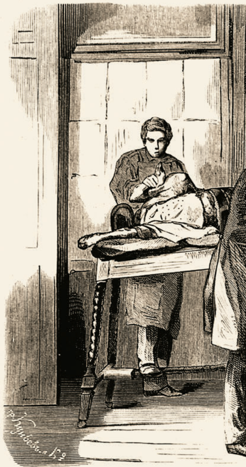
Прививание оспы въ К...