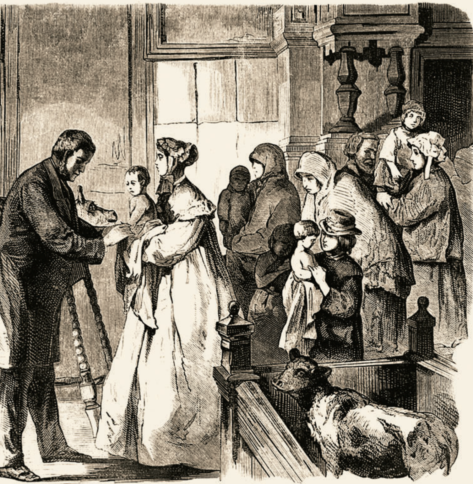
въ Императорскомъ воспитательномъ домѣ, въ С.-Петербургѣ. (Рисовалъ Васнецовъ, гравировалъ Куневъ.)