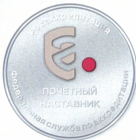
Рисунок знака отличия Федеральной службы по аккредитации «Почетный наставник Федеральной службы по аккредитации»