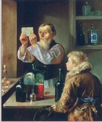
А. Гранковский. Деревенский кулак. 1879 г. Воронежский музей.

А. Б. Чубайс , первый заместитель Председателя Правительства РФ, министр финансов РФ