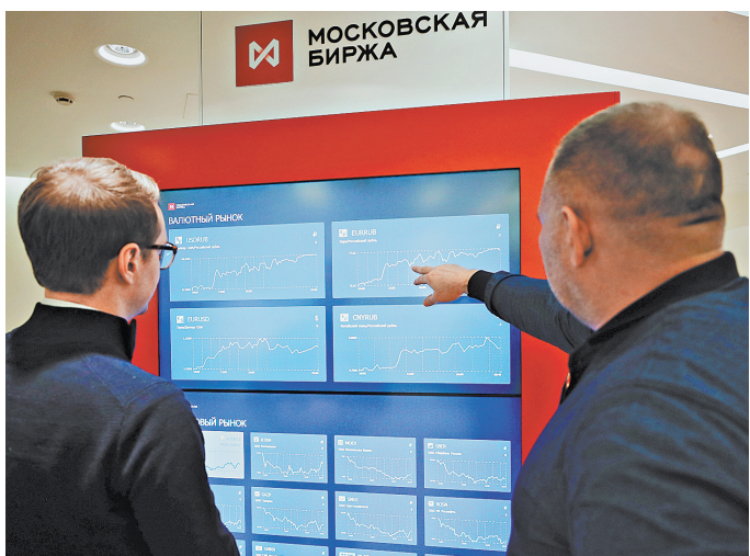
Частные инвесторы в первую очередь смотрят на потенциал роста акций размещающихся компаний.