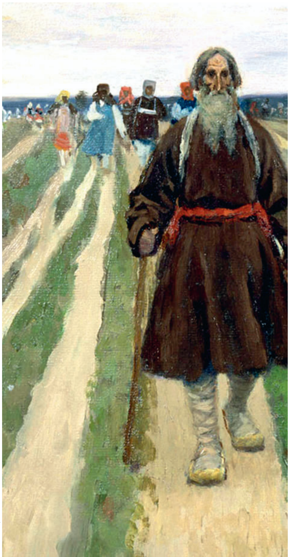
С. КОРОВИЧ. К ТРОИЦЕ. 1992

Что понял про него писатель, родившийся 200 лет назад, — в очерке Максима Васюнова. (С. 64)