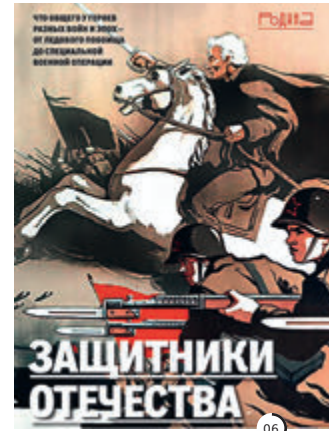
° 2-6 Специальные выпуски журнала «Родина».