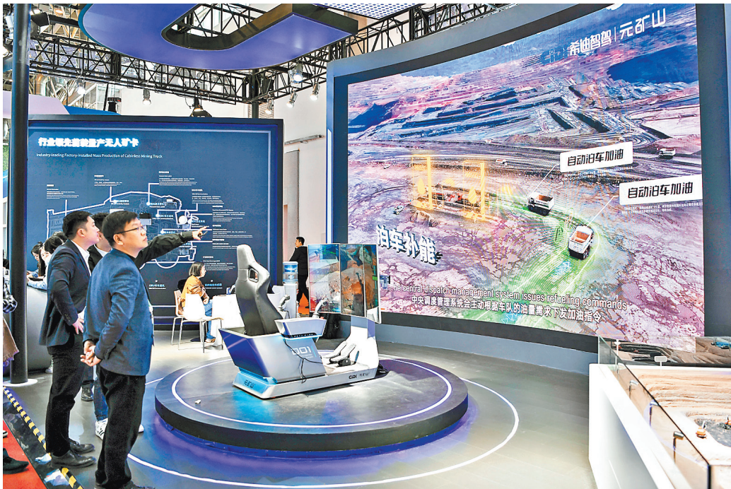
Посетители второй Китайской международной выставки цепочек поставок знакомятся с системой Meta Mine от компании CiDi, поставщика технологий и продуктов для беспилотного управления. Пекин.

В Гуанчжоу, провинция Гуандун, автобусный маршрут с уровнем автономности 4 накопил уже более 2,1 миллиона километров пробега с использованием технологий китайской компании WeRide. Уровень 4 означает высокий уровень автоматизации, при котором транспортное средство может выполнять все функции управления в определённых условиях без участия водителя.