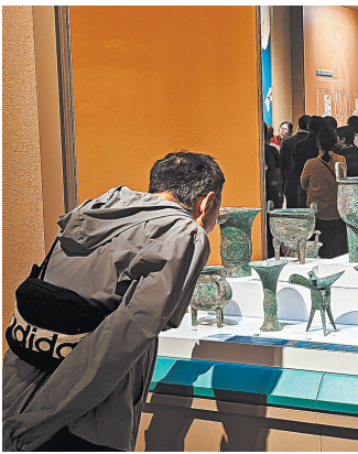
Посетители внимательно изучают артефакты в музее Иньской в Аньяне, провинция Хэнань.

На улицах старого города Лояна посетители в роскошных нарядах на фоне прекрасно сохранившейся старинной архи-