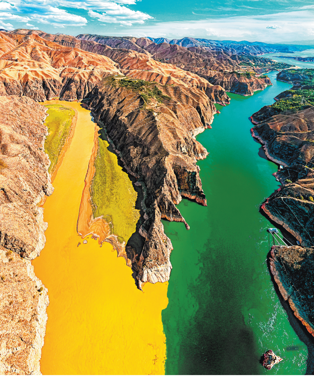
Каменный лес на реке Хуанхэ в городе Байинь, провинция Ганьсу, известен своими величественными каменными столбами и суровыми скальными образованиями.

Здесь пейзаж сменяется: вместо сформированного водой извивалка Линься взору открываются бескрайние ветро-