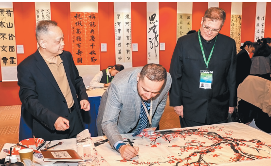
Участник мероприятия подписывает традиционную китайскую картину, выполненную тушью.

Сам язык также его завораживает. «Китайский — поэтический и красивый. Добавив один иероглиф — и смысл полностью меняется», — сказал он. — Именно так я в него и влюбился».