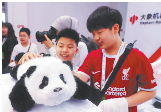
Юные посетители Всемирной конференции роботов в Пекине знакомятся с роботом-компаньоном в виде панды.

На китайской платформе для обмена лайфстайл-контентом «Сяохуншунь», также известной как Little Red Book (с китайского переводится как «маленькая красная книга»), стали чрезвычайно популярны инструкции о том, как изменить настройки ИИ-приложений, например DeerSeek, чтобы придать им определенный характер — например, саркастичный или властный.