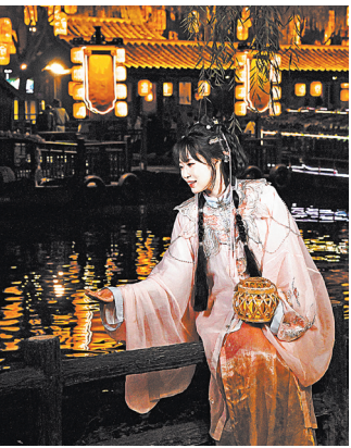
Гости в традиционных костюмах погружаются в атмосферу ночного Кайфэна, провинция Хэнань.

тектуры создают ощущение полного единения с эпохой расцвета династии Тан. Многие заведения предлагают аренду костюмов и профессиональный макияж — около 100 юаней (1123 рубля). Облечившись в свободные одежды с широкими рукавами и украсив причёску изящными шпильками, гости мгновенно перевоплощаются в представительниц танской знати, прогуливающихся по историческим кварталам.