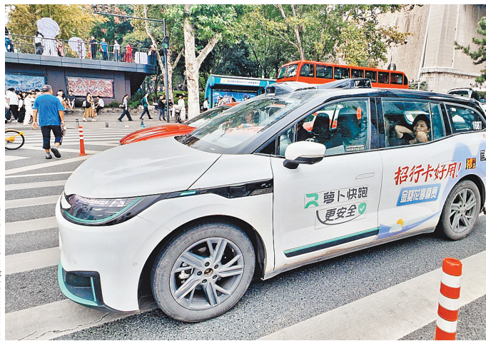
Беспилотный автомобиль Apollo Go, сервиса роботакси компании Baidu, на улицах Уханя, административного центра провинции Хубэй.

В ноябре подразделение Didi Autonomous Driving объявило о стратегическом соглашении с Инвестиционным офисом Абу-Даби (ADIO) для укрепления своего присутствия на ближневосточном рынке. Компания присоединится к промышленному кластеру автономного транспорта Savi Cluster в ОАЭ. Стороны договорились развивать сотрудничество в области инноваций автономного вождения, подготовки кадров в сфере ИИ и построения экосистемы. ■