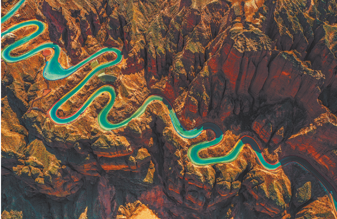
Каменный лес на реке Хуанхэ в городе Байинь, провинция Ганьсу, известен своими величественными каменными столбами и суровыми скальными образованиями.

По пути можно увидеть уникальный ландшафт Каменного леса Бинлин, где вздымающиеся