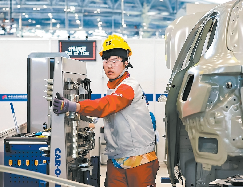
Участник соревнований выступает в категории «Окраска автомобилей» на третьем Конкурсе профессионального мастераства Китая в Чжэнчжоу, провинция Хэнань.

«На Конкурсе, который длился три дня, моделирова-