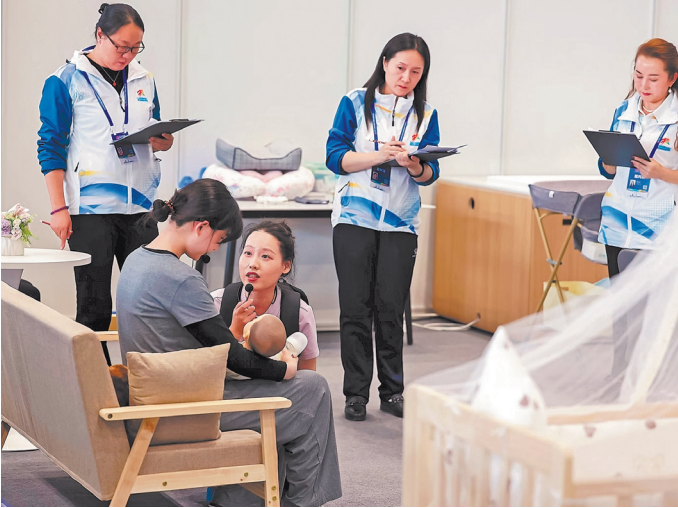
Судьи оценивают выступления участников в номинации «Уход за детьми раннего возраста».

Модуль по управлению здоровьем проверял ее умение вводить лекарства и реагировать на поставкационные осложнения. В разделе медицинского ухода требовалось продемонстрировать технику туйна (традиционный китайский массаж) и выполнить сердечно-