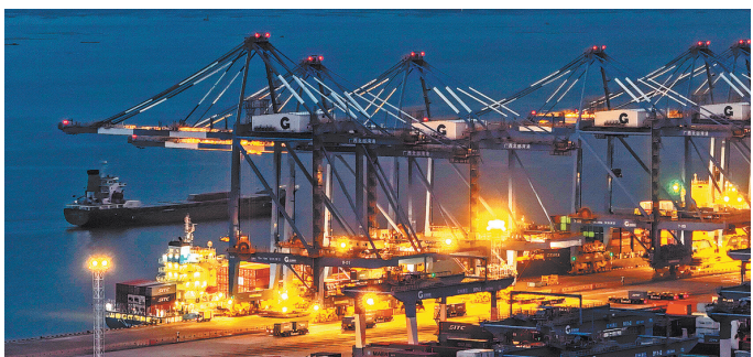
Вид с воздуха на порт Циньчжоу. Снимок сделан с дрона в Гуанси-Чжуанском автономном районе Китая.

промежуточными и «зелёными» товарами, развитию цифровой торговли и созданию новых драйверов роста внешней торговли. Китай также будет стремиться к диверсификации рынков и углублению интеграции внутренней и внешней торговли.