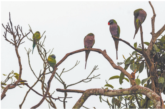
Несколько ожереловых попугаев Дерби на ветвях бамбана в деревне Манба, город Пуэр, провинция Юньнань.