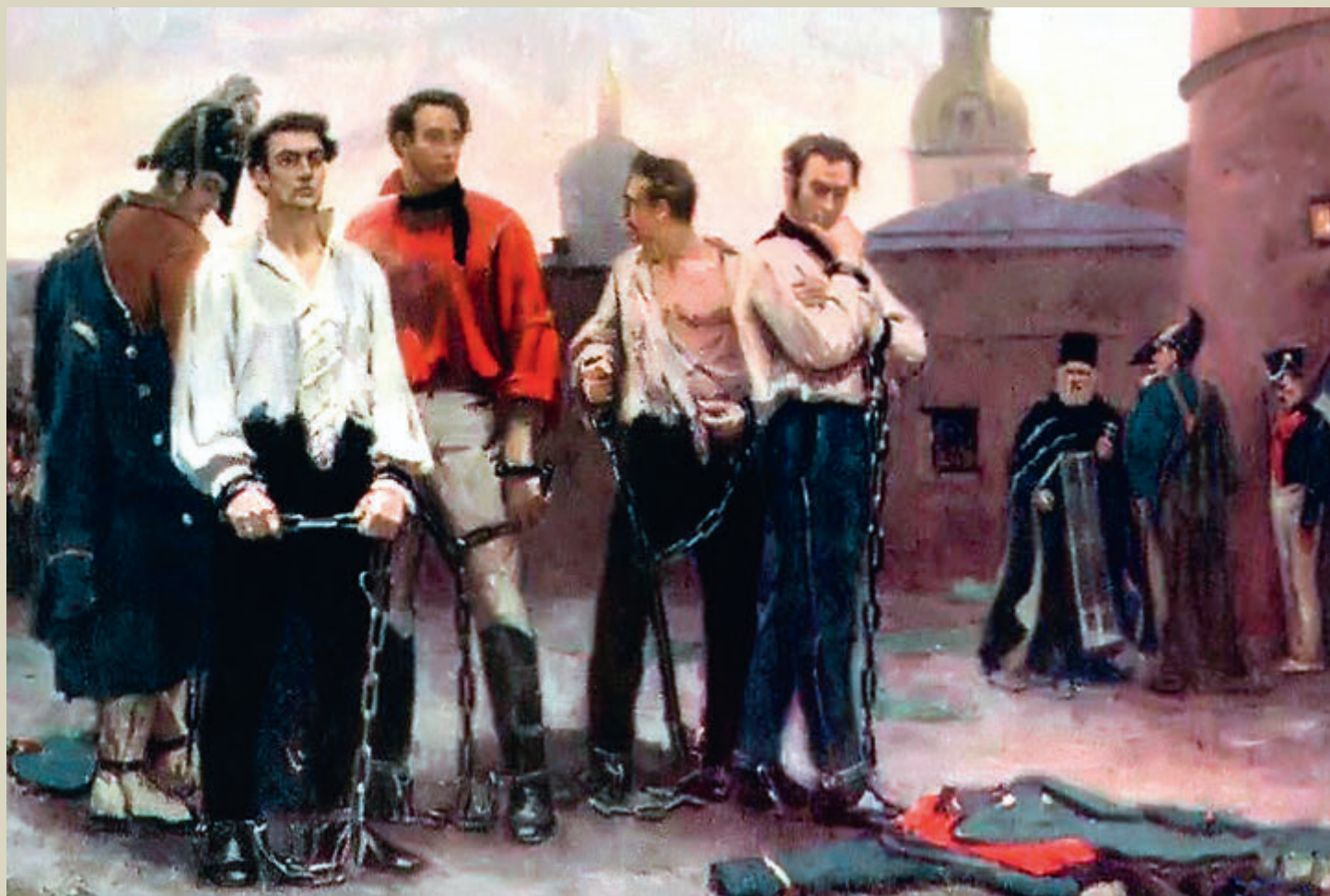
С. ЛЕВЕНКОВ. ДЕКАБРИСТЫ. 1990

Тему номера, посвященную 200-летию восстания на Сенатской площади (с. 26–70), завершаем песней Александра Городницкого в исполнении автора.