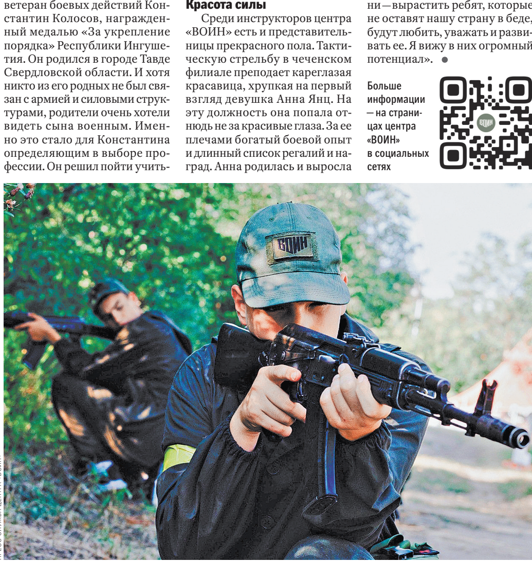
На занятиях по тактической подготовке курсанты отрабатывают навыки взаимодействия.

«Сын был в восторге, похудел, поздоровел, открыл много интересного, заинтересовался военной-учетной специальностью, огромная вам благодарность. Рассказывал про стрельбу, запуск дронов, спортивное ориентирование, это очень хорошо для его возраста (15 лет).»