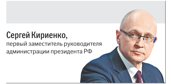
Сергей Кириенко, первый заместитель руководителя администрации президента РФ

Сегодня патриотическое воспитание выходит на передний план. Ключевой вызов для страны — что мы передадим будущему поколению, во что они будут верить.