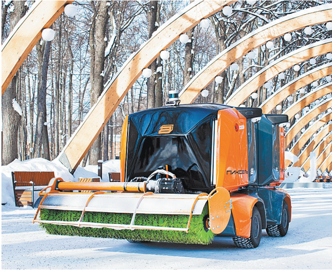
ПЕКС СЛУЖБА ПАРКА «СОКОЛЬНИКИ».

Робот — машина, надо сказать, немаленькая: в длину около двух с половиной метров, порядка полутора в ширину, а высота — чуть ниже среднего человеческого роста. Несмотря на внушительные габариты, опасности для зазевавшегося прохожего робот не представляет: во-первых, потому что окрашен в ярко-оранжевый, заметный издали цвет. А во-вторых, оснащенный множеством датчиков и обзорных камер, механический дворник в рабочем режиме движется со скоростью пешехода — до пяти километров в час.