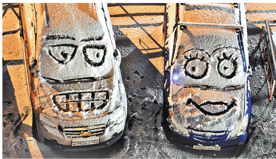
Покупателю подержанной машины стоит помнить, что зачастую он соглашается на «кота в мешке».

28 процентов выше январских результатов, отмечается в исследовании. Тем не менее, как констатирует информационно-аналитическое агентство «Автостат», российский рынок автомобилей с пробегом вырос на 17 процентов — до 5,69 миллиона единиц.