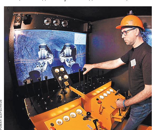
В России многие предприятия переживают свое второе рождение, их продукция заменяет импортную.

— В России многие промышленные предприятия, ранее пребывавшие в полуживом состоянии, возрождаются, их продукция заменяет импортную, — продолжает Александр Калинин. — Зачастую она выпускается в кооперации с белорусскими партнерами. К примеру, налаживается производство шлангов высокого давления для гидравлики тракторов, комбайнов, экскаваторов, что раньше закупалось по импорту. Сообща создается оборудование очистки воздуха для медицинских и производственных целей. За два минувших года стало ясно, что та-