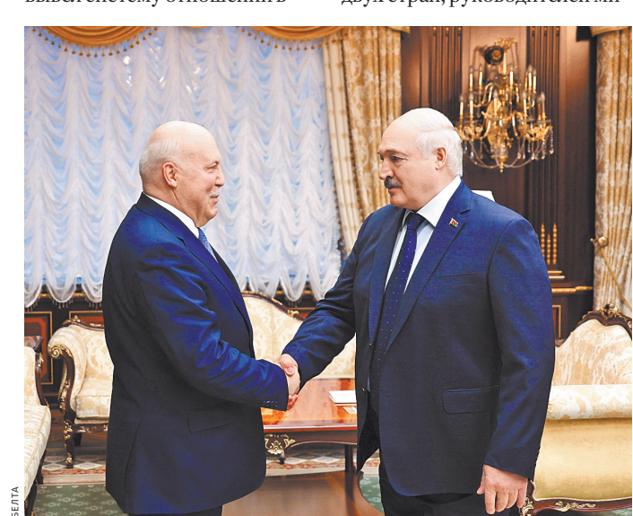
Госсекретарь Союзного государства поблагодарил белорусского лидера за возможность встречи.

В повестке предстоящего ВГС — доклады правительства двух стран, руководителей ми-