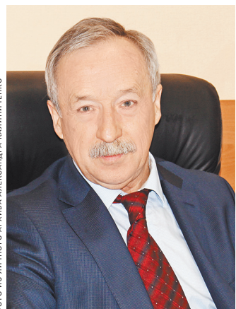
Александр Калинин: Беларусь все чаще работает в кооперации с россиянами.

1 → Немалая заслуга в этом ученых и разработчиков новых технологий. На конференции в БГТУ рассмотрены пути обеспечения экономической безопасности на постсоветском пространстве, развитие единого образовательного пространства, формирование научно-технологической политики Союзного государства, участие белорусских организаций в нацпроектах РФ. Были представлены инновационные технологии и оборудование. Состоялся конкурс молодежных проектов, победителями которого стали студенты БГТУ и Тамбовского государственного технического университета.