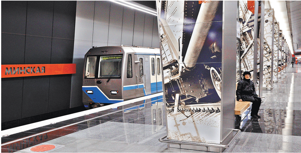
Станцию «Минская» в российской столице запустили в 2017 году — название она получила по расположенной рядом одноименной улице.