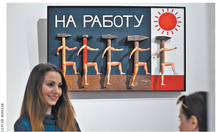
Спрос на «белых воротничков» этой осенью падает, а на «синих» — растет.

ПЕРСОНА / Почему сегодня так необходим Shaman? Песня для миллионов