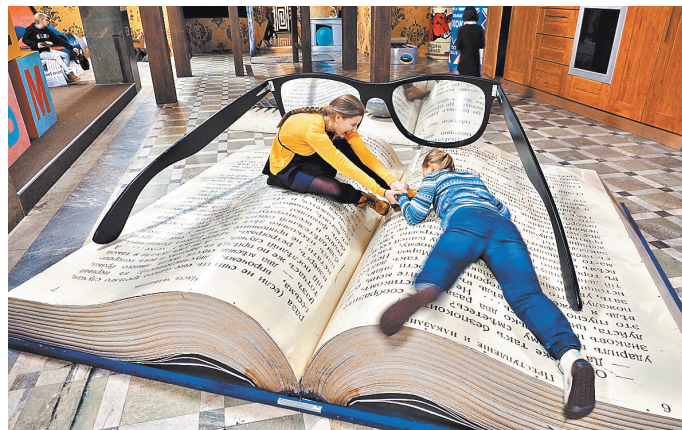
Книга не только лучший подарок, но и самый умный друг.

— Еще в третьем классе перечитал все книги в детской библиотеке, поэтому мне посоветовали записаться во взрослую. Вел читальную дневник, записывая свои мысли по пово-