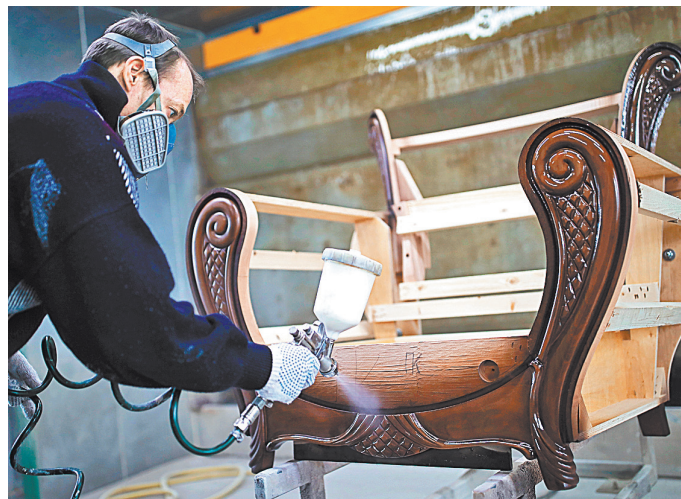
Хороший сборщик мебели в Москве может заработать до 200 тысяч рублей.

стоянно востребованы врачи, медицинские сестры, ветеринарные врачи, инженеры. В числе вакансий некавалитен и удержанием персонала, в то время как соискатели стали заметно реже соглашаться на неинтересные для себя условия труда и оплаты. Сейчас ситуация оживилась: наниматели снизили планку требований и стали предлагать адекватные условия с актуальной зарплатой, а соискатели активно занялись поиском новой работы и дополнительной занятости. Об основных трендах рассказали в Министерстве труда и социальной защиты. Сначала 2022 года общереспубликанский банк вакансий посетили свыше 8 миллионов раз. При этом растет активность соискателей — они чаще размещают свои резюме. Их количество увеличилось за последний год в 1,5 раза и на 1 сен-