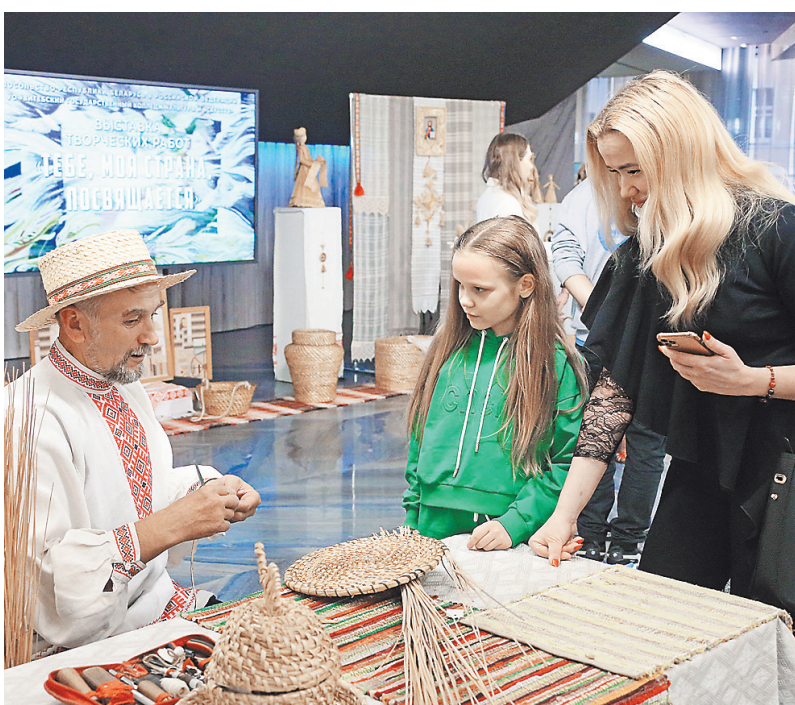
Участники вечера сами оценили, как работают мастера из Витебского колледжа культуры.