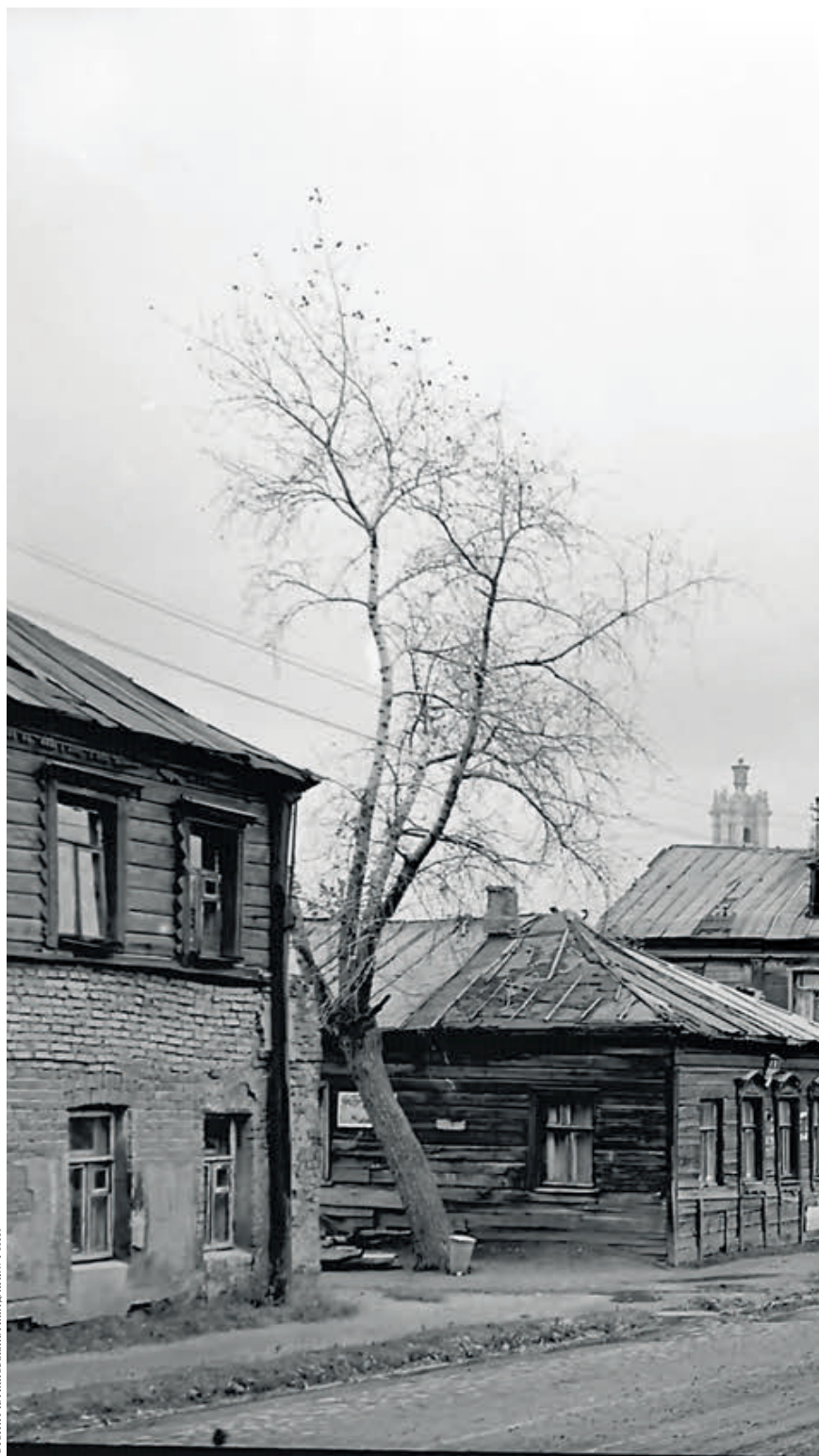
ФОТОГРАФИИ И ГРАВЮРЫ ИЛЛЮСТРИРОВАНЫ АРХ. № 1-55389