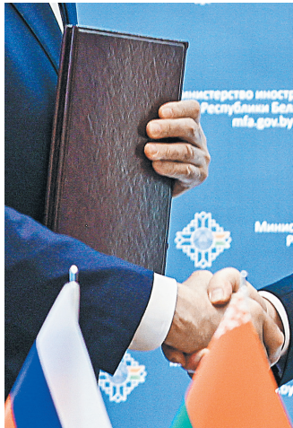
Визит Сергея Лаврова был приурочен к 30-летию дипотношений Беларуси и России.

В филиале Российского государственного социального университета в Минске под председательством Сергея Лаврова состоялось выездное заседание комиссии Генерального совета партии «Единая Россия». Рассматривались вопросы общественной поддержки Союзного государства и евразийской интеграции, поддержки соотечественников за рубежом. Председатель ко-