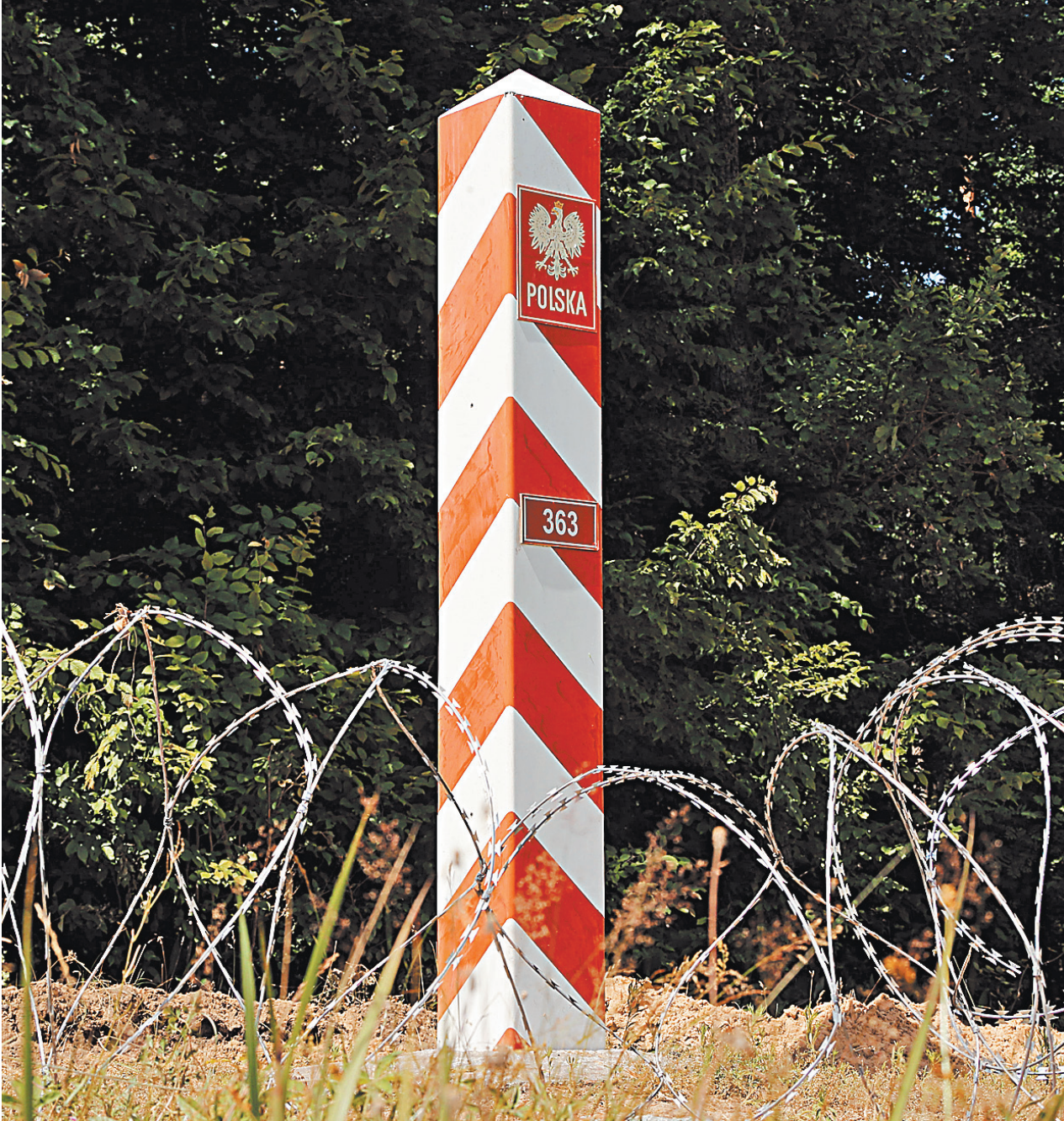
Длина забора, разделявшего Беловежскую Пущу, — 64 километра.

По дороге Бурый не перестает восхищаться красотой леса. Показывает нам аккуратно сложенные штабеля стволов после санитарной рубки. В национальном парке существует собственная система предупреждения пожаров — наблюдение ведется со специаль-