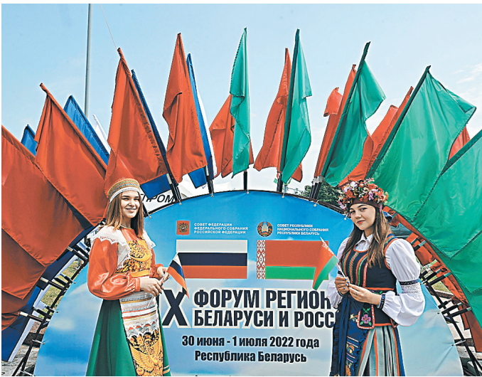
Гродно впервые принимал у себя такой масштабный форум: одновременно в город приехали более тысячи гостей.

Культура / «Славянский базар в Витебске» ждет в гости казачий ансамбль «Ставрополье» Шашки наголо