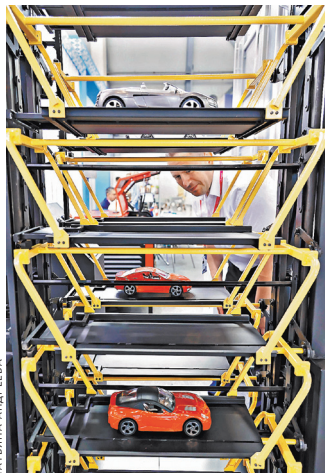
Автоматизированная карусельная линия производства «Гомсельмаша» очень нужна в микрорайонах точечной застройки.