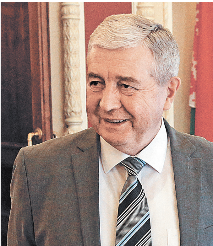
Владимир Семашко возглавляет диппредставительство Беларуси в России с ноября 2018 года.

Традиции / На праздник в Александрии ждут гостей из 19 регионов России «Купалье» собирает друзей