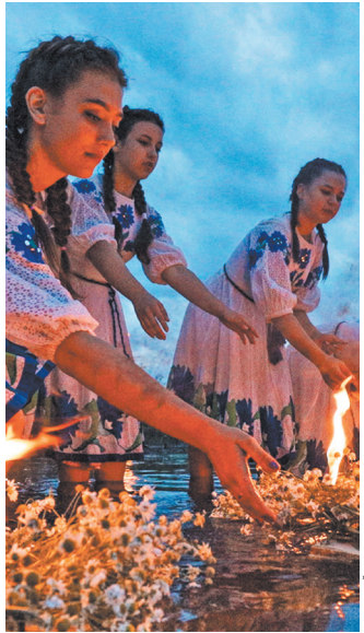
Праздник по многолетней традиции пройдет на берегу Днепра.

На фестивале «Купалье» в Александрии можно будет купить брендовые вещи проекта «Мерч Первого» — майки и свитшоты с остроумными и афористичными высказываниями лидера Беларуси. Популярную линейку одежды, пользующуюся ажиотажным спросом, придумали белорусские журналисты