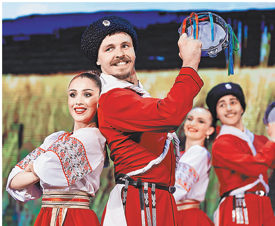
Участие в «Славянском базаре в Витебске» коллектив с юга России считает большой творческой удачей.

Государственный казачий ансамбль песни и танца «Ставрополье» — один из ведущих казачьих коллективов страны. Его высоко исполнительское мастерство отмечено множеством наград и премий в области музыкального и хореографического искусства, а география гастролей обширна: Испания, Италия, Франция, Нидерланды, Греция, страны Восточной Европы, США, Канада, Новая Зеландия, Австралия, КНДР, Япония. История коллектива началась в 1981 году. Сегодня в нем более 180 человек, четыре основные творческие группы: оркестровая, хоровая, балетная и эстрадная. В составе казачьего ансамбля песни и танца — высокопрофессиональные артисты, имеющие почетные звания, лауреаты всероссийских и международных конкурсов. В репертуаре хора сотни песен. По версии туристического портала «Тур-Стат», в 2020 году (в пандемию) коллектив вошел в пятерку самых популярных ансамблей России и режисме онлайн-трансляций.