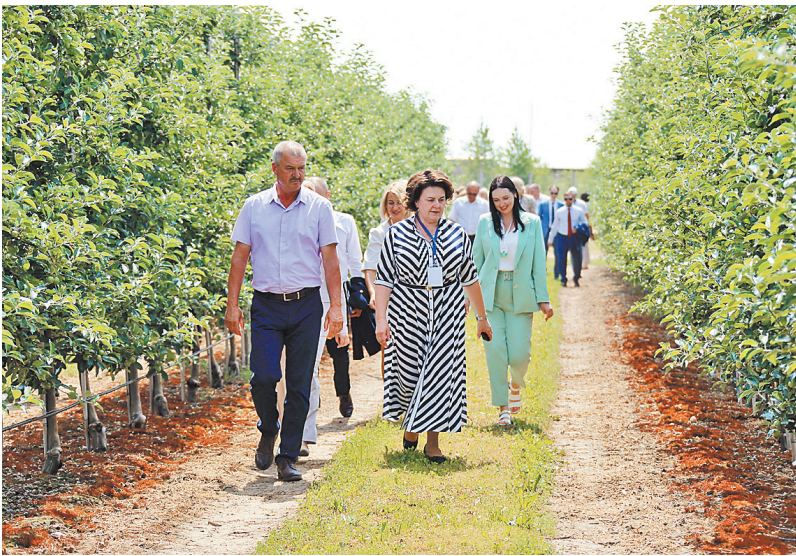
После заседания члены делегации заглянули в черешневый квартал фруктового сада, чтобы на деле оценить возможности импортозамещения.